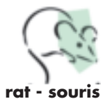
rat - souris